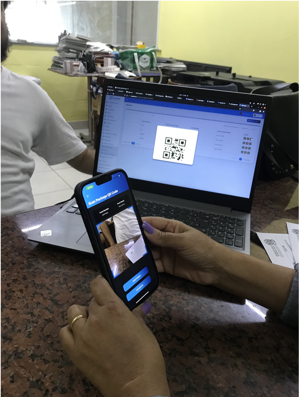
Fig. 04 – Apresentação do Software