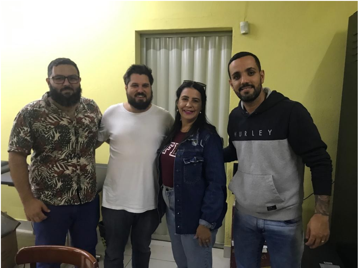
Fig. 05 – Visita Técnica