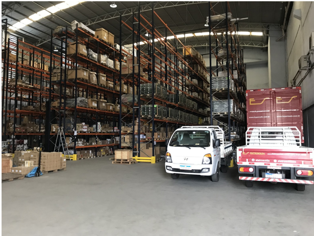
Fig. 01 – Depósito da Engesolda – onde são realizados os testes práticos